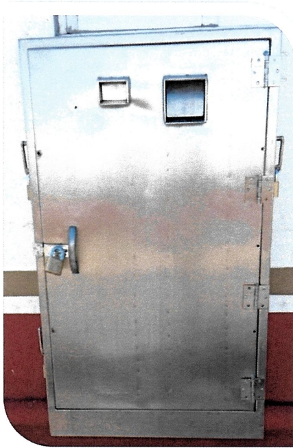
CESTA DE RECUPERACIÓN DE TAGS.

Sin más por el momento aprovecho la ocasión para enviar un cordial saludo